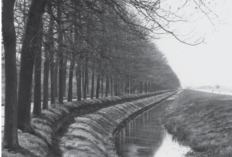
Het zeewaterkerende dijkgedeelte Hogeweg langs het Overijssels Kanaal.

Woonboerderij Pauline's Hoeve, Grote Hagenweg 1, tevens het postadres van het landgoed.